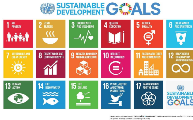
Gambar 4. 2 Tujuan Sustainable Development Goals (SDGs)

Selanjutnya pada tataran di daerah perlu dipikirkan mengenai bagaimana mendukung pencapaian tujuhbelas tujuan SDGs. Pembangunan daerah berwawasan lingkungan mensyaratkan pertumbuhan ekonomi yang berjalan secara simultan dengan kelestarian lingkungan. Transisi menuju paradigma pertumbuhan ekonomi hijau ini perlu memperhatikan beberapa hal sebagai pra kondisikeberhasilan, seperti insentif dan disinsentif aktivitas ekonomi hijau, review kebijakan yang tidak pro lingkungan, dan kapasitas pengembangan teknologi melalui penelitian dan pengembangan (litbang). Berbagai insentif yang telah disediakan pemerintah terutama di bidang EBT dirasa kurang memadai karena terkendala pada harga BBM dan energi listrik yang begitu murah.