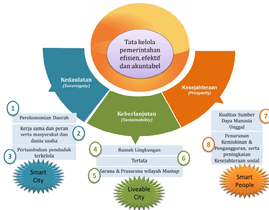
Gambar 4. 6 Smart City Framework

Guna mewujudkan Kota Tangerang Selatan menjadi cerdas ( Smart City ) dan kota yang layak huni ( Liveable City ) tentunya perlu didukung dengan tata kelola pemerintahan yang baik. Tata kelola pemerintahan lebih professional, modern, maju dan akuntabel, sehingga memberikan layanan terbaik kepada masyarakat. Tata kelola yang baik, dalam bahasa Inggris sering disebut sebagai Good Governance adalah serangkaian proses yang berlaku untuk kedua organisasi sektor publik dan swasta untuk menentukan keputusan.