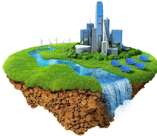
Gambar 4. 1 Ilustrasi Green City

Ada enam kriteria yang diukur dalam green building yaitu pengolahan lahan sekitar, penggunaan air, penggunaan energi, material dan dari mana sumber material itu, kualitas di dalam ruangan, dan inovasi. Untuk menunjang menjadi Green City , perlu menjalankan konsep Green Planning and Design , Green Open Space , Green Building , Green Transport , Green Community , Green Waste , Green Water , dan Green Energy . Setelah melakukan kampanye green building, Pemerintah Kota Tangerang Selatan perlu melakukan evaluasi greenship pada bangunan-bangunan yang ada di Kota Tangerang Selatan. Setelah diadakan evaluasi, berlanjut penerapan green building, persiapan pembuatan Perda (Peraturan Daerah), pelaksanaan Perda. Apabila landasan hukumnya sudah ada dan kuat sebagai pijakan, maka masyarakat benar-benar dapat menerapkan hidup dengan ramah lingkungan dan rendah emisi.