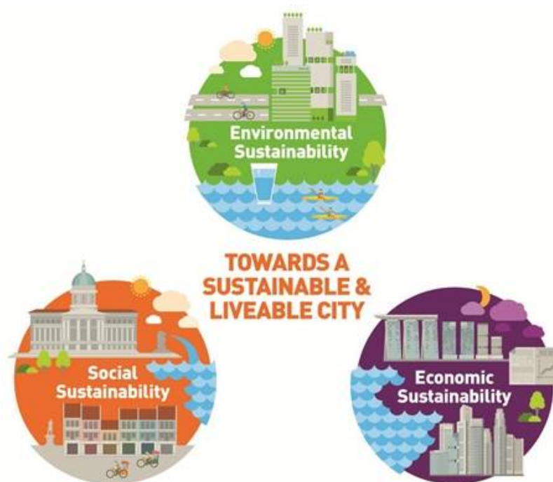
Gambar 4. 3 Sustainable Liveable City

Kota Tangerang Selatan mendapat penghargaan dari The Eastern Regional Organization for Planning and Housing (EAROPH) yang merupakan organisasi non-pemerintah yang berafiliasi dengan Perserikatan Bangsa-bangsa (PBB). EAROPH memberikan penghargaan kepada sejumlah daerah kabupaten/kota atas terobosan mereka dalam pembangunan. Penghargaan yang diterima Kota Tangerang Selatan berkaitan dengan Public & Private Partnership for Public Space Division . Kota Tangerang Selatan mendapat penghargaan karena berhasil membangun kerjasama pemerintah dan swasta. Kota Tangerang Selatan tidak memiliki banyak anggaran namun berhasil menggandeng para pengembang-pengembang untuk membangun bersama-sama menjadikan Tangerang Selatan sebagai kota yang nyaman/layak huni ( liveable city ).